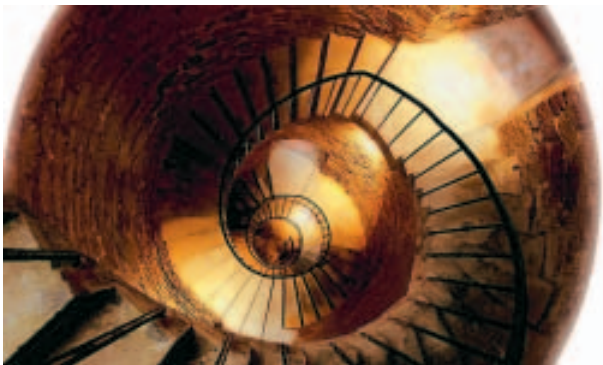
"Ronds": tel était le thème du mois de novembre.

C'est avec cette photo d'escalier que Jean Laurent de Longwy alias "Link" a gagné le concours de novembre du forum photo beluxphoto sur le thème "ronds". Pour vous inscrire: www.beluxphoto.com